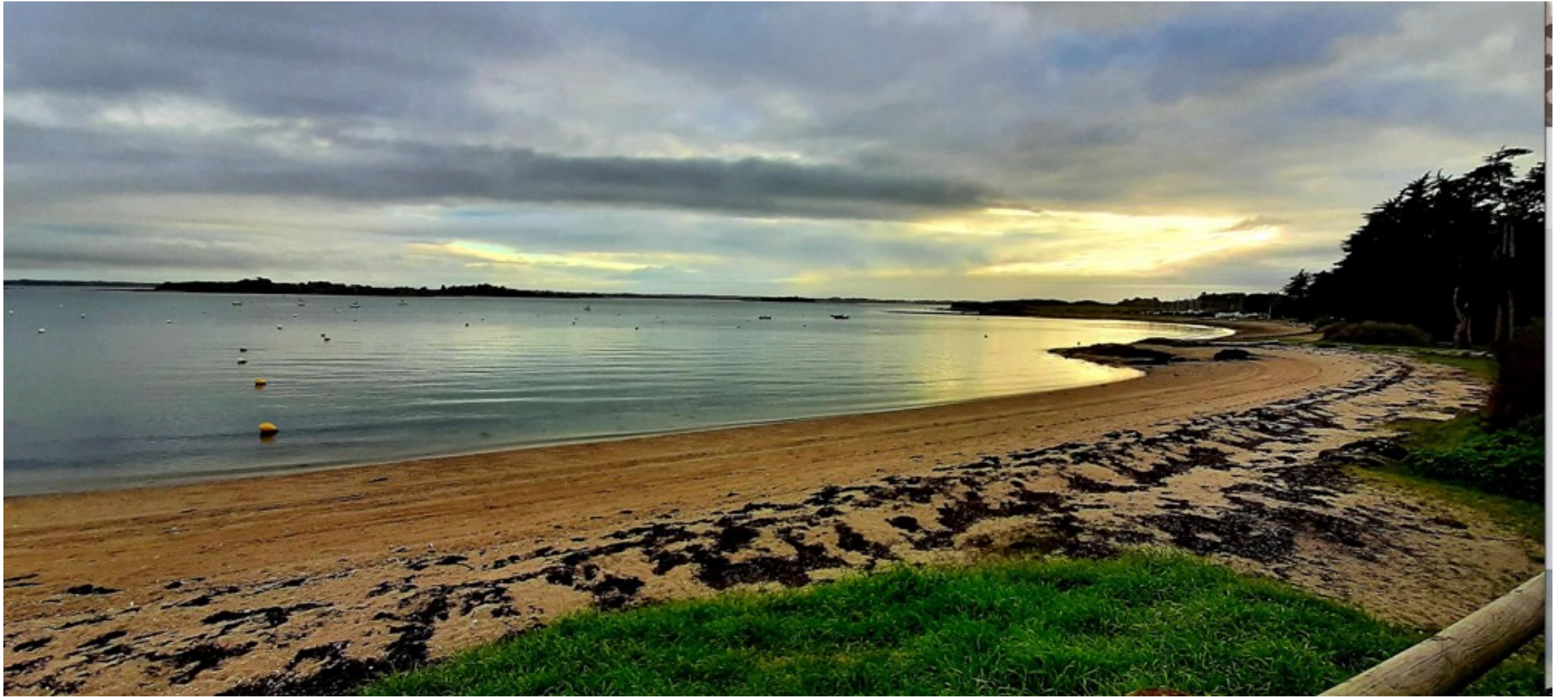
La plage du Domaine de Bilhervé