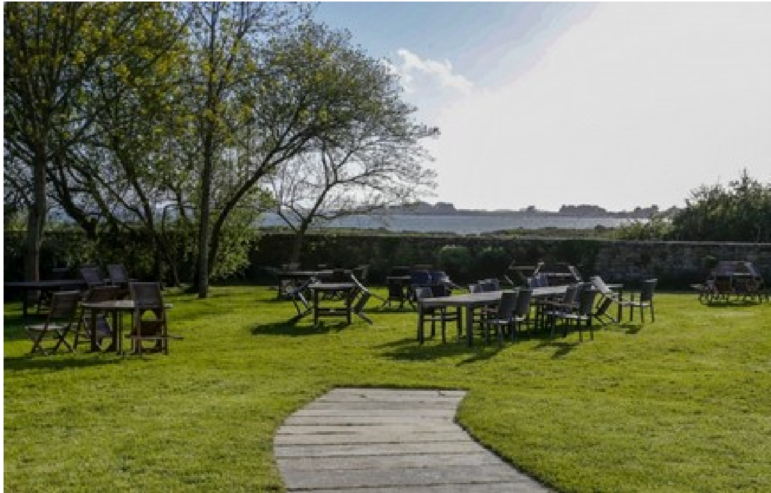
"Le jardin" , espace de restauration extérieur